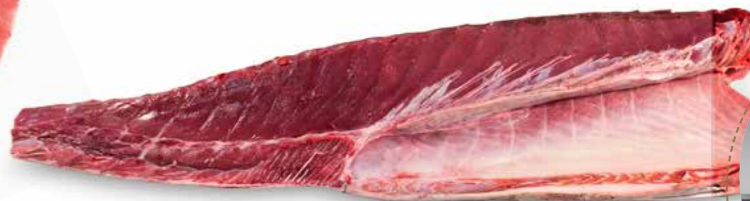
⤴ LLOM BLANC SENCER