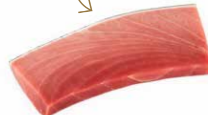
(10205) TABLETA individual ATUN BIG EYE S/SANG CONG.