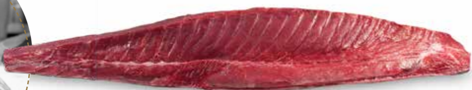
⤴ LLOM NEGRE SENCER