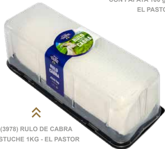
◀ (3978) RULO DE CABRA ESTUCHE 1KG - EL PASTOR