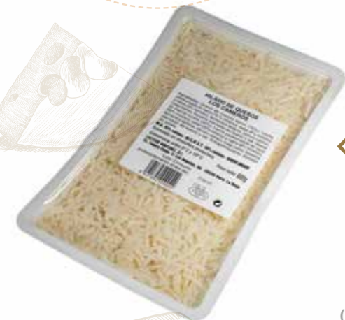
⌞ (5646) BANDEJA HILADO DE QUESO 600 gr - CAMEROS