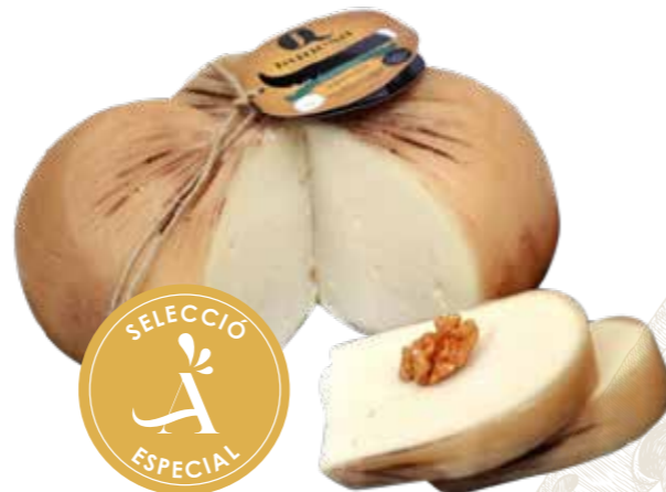
(944) QUESO SERVILLETA LA CABRITA ▶▶