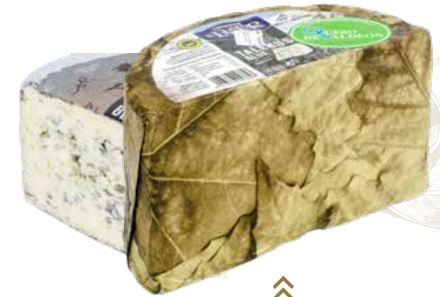
⌞ (6907) QUESO AZUL IGP TALENUS 3KG - EL PASTOR