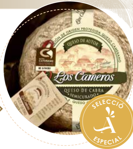
(5639) MINIQUESO DE CABRA SEMI D.O.P. - CAMEROS ▶▶