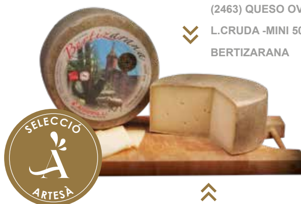
⌞ (2463) QUESO OVEJA L.CRUDA - MINI 500G CHIQUI- BERTIZARANA