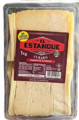
⌞ (584) CUÑITA OVEJA CURADO EL ESTANQUE 4x1kg - CAMEROS