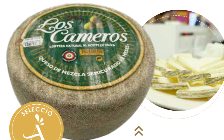
(5635) QUESO MEZCLA SEMI - CORTEZA NAT - CAMEROS