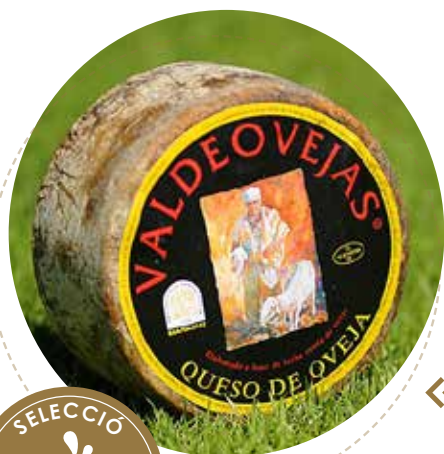
⌞ (376) QUESO OVEJA VALDEOVEJAS