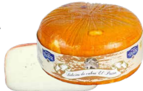
(1754) DELICIAS DE CABRA 2,5 KG EL PASTOR ▶▶