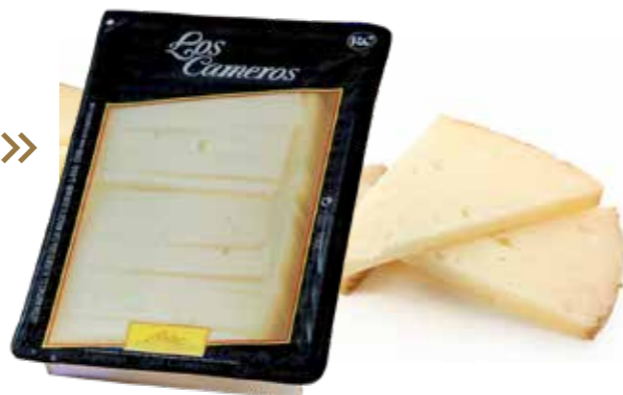
⌞ (7951) LONCHAS DE BARRA 500g - CAMEROS