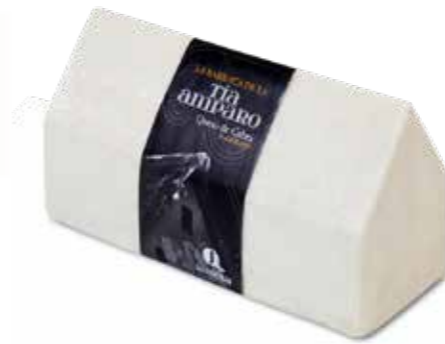
◀ (2664) QUESO BARRA CABRA TIA AMPARO