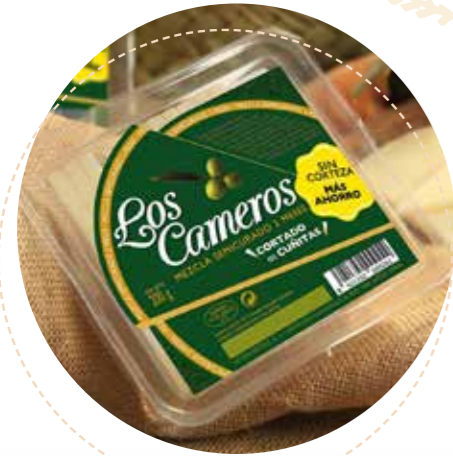
⌞ (5643) CUÑITA LONCH. (eti. roja) QUESO MEZ.CURADO 8x200 gr - CAMEROS