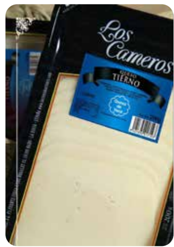
⌞ (5640) LONCHAS QUESO 8X200 gr - CAMEROS