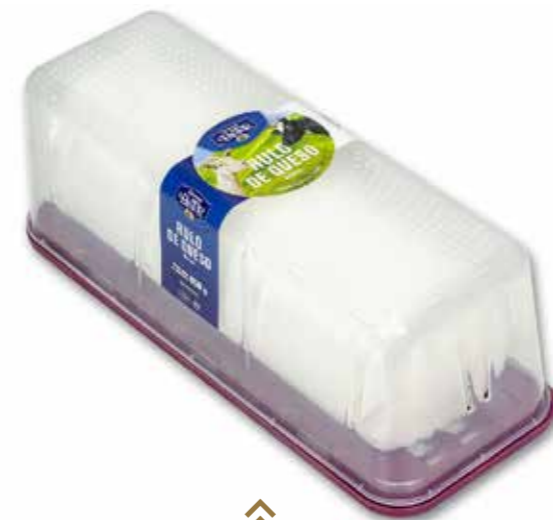
⌞ (9979) RULO DE MEZCLA ESTUCHE 850G EL PASTOR