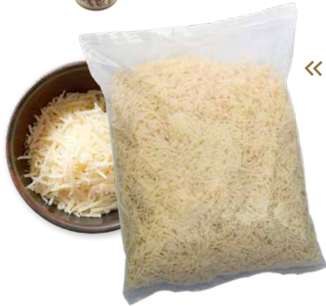
(5791) BOLSA RALLADO MIX 1KG - EL PASTOR