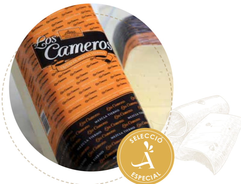
(5633) BARRA -naranja- QUESO MEZCLA - CAMEROS

Amb especial cura pel formatge, Los Cameros elabora les peces rentades a mà amb banys d'oli d'oliva i la seva maduració és rigorosa i lenta. La majoria dels formatges són de mescla, amb formats habituals rodons de 2,5 kg, en barra o llescats.