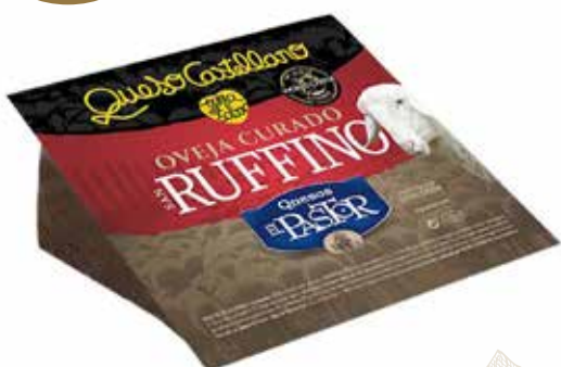
⌞ (520) CUÑA QUESO OVEJA CURADO RUFFINO 250G. PASTOR