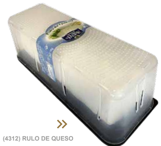
⌞ (4312) RULO DE QUESO ESTUCHE 1KG EL PASTOR