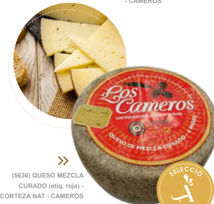
(5636) QUESO MEZCLA CURADO (etiqa. roja) - CORTEZA NAT - CAMEROS