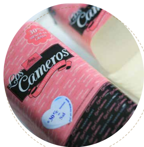
(5632) BARRA -rosa- QUESO LIGHT BAJO EN SAL - CAMEROS