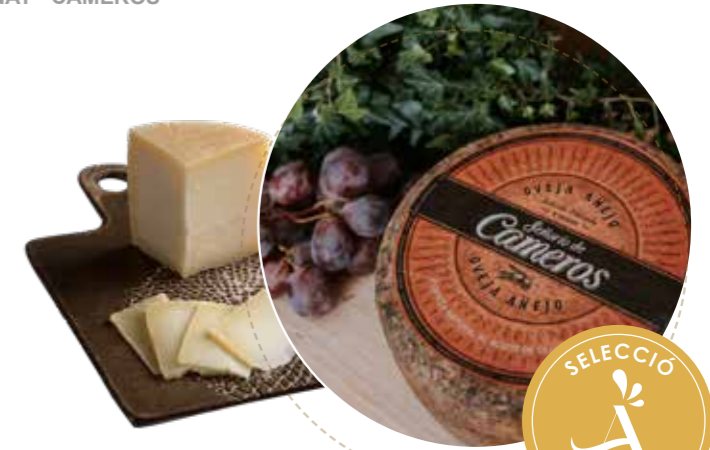
(6938) QUESO OVEJA AÑEJO - CORTEZA NAT - CAMEROS ▶▶