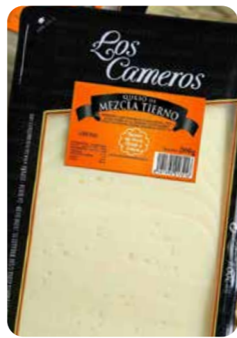
⌞ (5641) LONCHAS QUESO MEZCLA 8x200 gr - CAMEROS