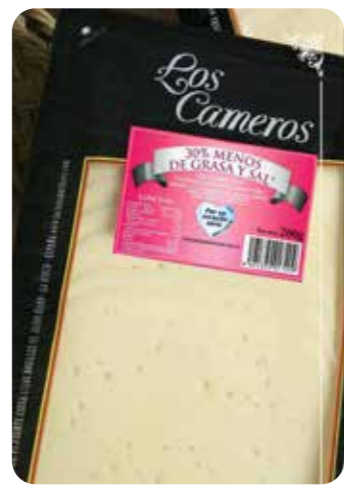
⌞ (5649) QUESO LONCHAS LIGHT BAJO SAL 8x200 gr - CAMEROS