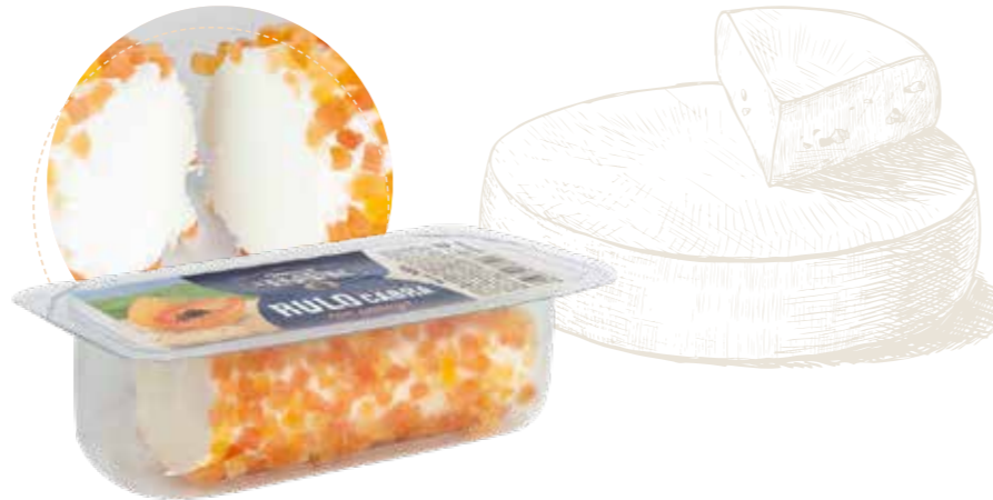
(5723) RULO DE CABRA CON PAPAYA 100 gr - EL PASTOR ▶▶