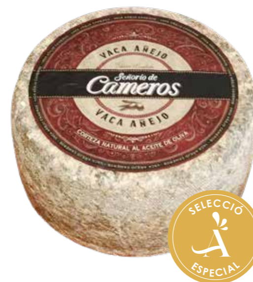
(6929) QUESO VACA AÑEJO - CORTEZA NAT - CAMEROS