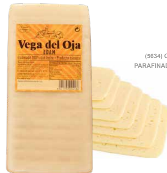
(7829) BARRA QUESO TIPO EDAM "VEGA DEL OJA" 2KG - CAMEROS