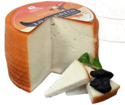
◀ (1267) QUESO CABRA MADURADO LA CABRITA