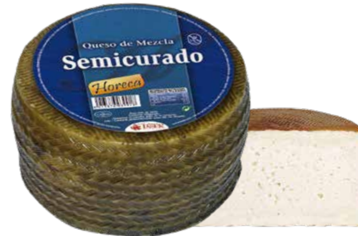
⌞ (5134) QUESO MEZCLA SEMICURADO - HORECA PASTOR