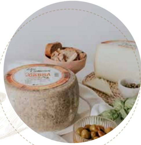
◀ (8963) QUESO DE CABRA SEMICURADO 3KG - CAMEROS