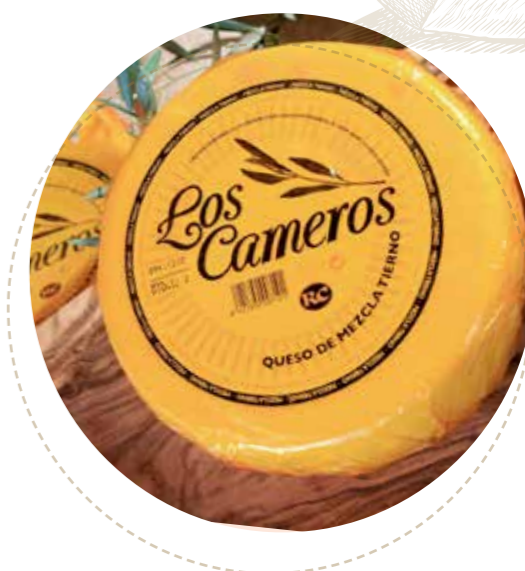
(5634) QUESO TIERNO PARAFINADO - CAMEROS