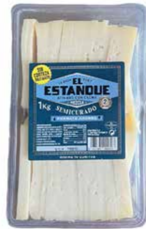
⌞ (581) CUÑITA MEZCLA SEMICURADO EL ESTANQUE- 4x1kg - CAMEROS