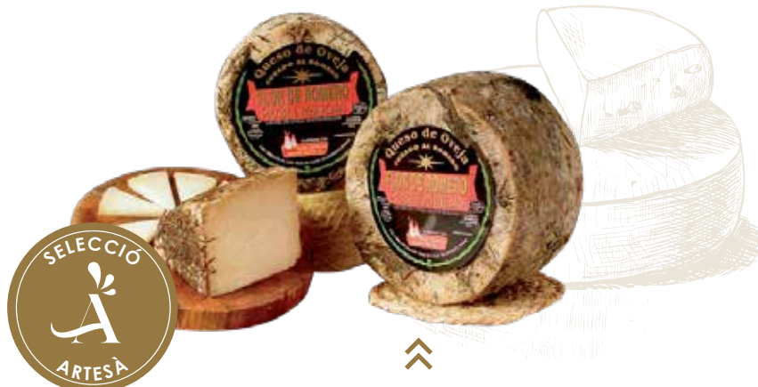
⌞ (358) QUESO 3KG FLOR ROMERO OVEJA CURADO