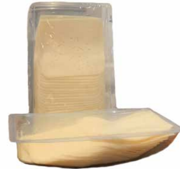
⌞ (870) LONCHAS BARRA VACA TIERNO "VEGA DEL OJA" 500g CAMEROS