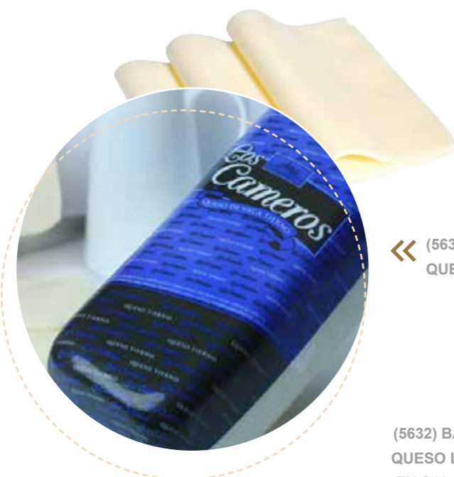
(5631) BARRA -azul- QUESO - CAMEROS