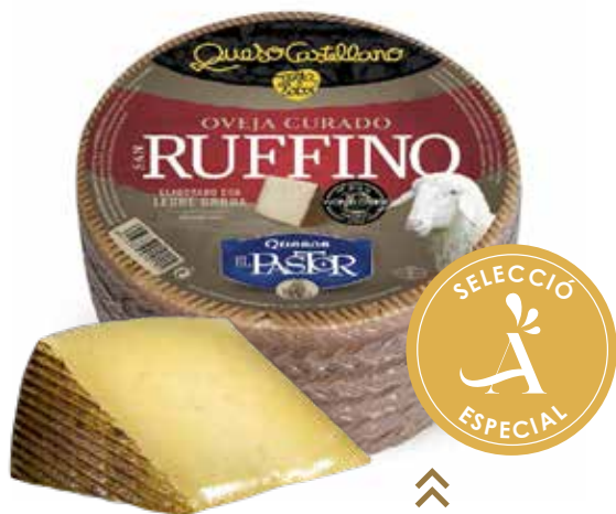
⌞ (503) QUESO OVEJA CURADO RUFFINO PASTOR