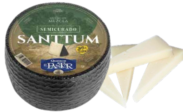
⌞ (502) QUESO MEZCLA SEMI SANTTUM PASTOR